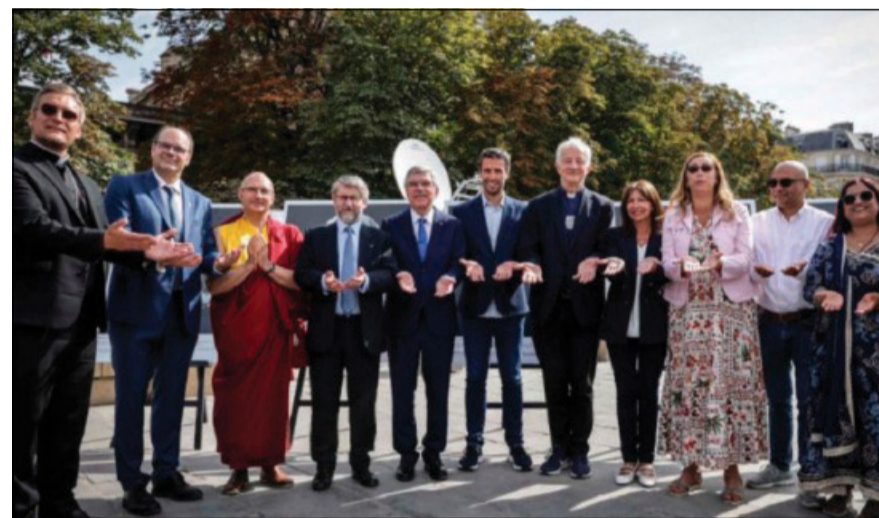
L'incontro interreligioso per la pace (Parigi, piazzale di Notre-Dame, 4 agosto)

«La pace è al primo posto» hanno indicato sia il presidente del Cio sia Holy Games, con un richiamo agli appelli di Papa Francesco per la tregua olimpica. Particolarmente apprezzata dalla comunità olimpica e paralimpica, ha detto Bach, è stata la «mobilitazione capillare in tutta la Francia, con il coinvolgimento di tantissimi volontari», proprio per assicurare un accompagnamento