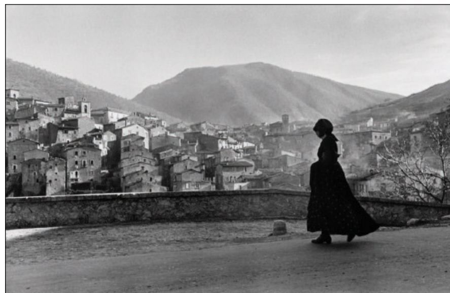
Henri Cartier-Bresson, «L'Aquila» (1951).

Come ha detto Papa Francesco ai partecipanti alla plenaria della Pcas il 17 maggio scorso, «il tema del Giubileo, Pellegrini di speranza , trova una sua singolare e suggestiva declinazione proprio nei percorsi catacombali». Lì si trovano i tanti segni del pellegrinaggio cristiano delle origini e il Papa sottolinea che «scopriamo in questi percorsi, i simboli e le raffigurazioni cristiane più antiche, che testimoniano la speranza cristiana. Nelle catacombe tutto parla di speranza e di vita».