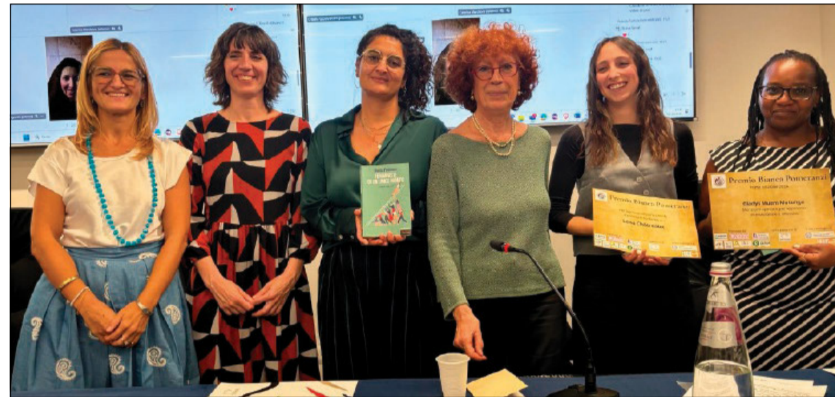
Un momento dell'assegnazione del Premio Bianca Pomeranzi

ranzi nel 1981 a Roma, tuttora impegnata in progetti per la salute e i diritti delle donne dall'Africa all'America Latina. Secondo Ugo Ferrero, responsabile Comunicazione e relazioni istituzionali di Aics, il supporto al premio nasce dalla presa d'atto che «le strategie e le azioni per l'uguaglianza di genere sono fattore essenziale di sviluppo sociale ed economico».